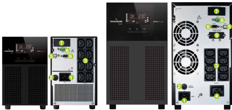
Ups Exa Plus 3.000